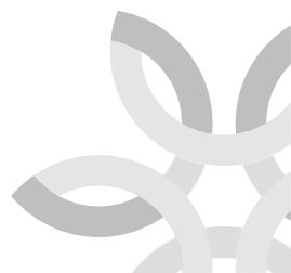
Figura 15 Notificación de envío recibido

Este es un mensaje automático desde Libros Abiertos . Le pedimos amablemente que no responda a este mensaje.