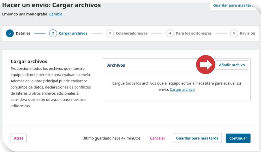
Figura 8. Cargar un nuevo archivo