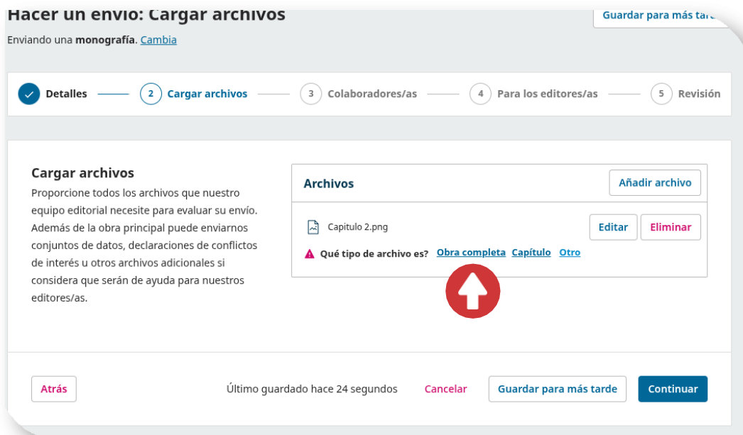
Figura 9. Lista de archivos cargados

Al cargar el archivo, se debe seleccionar su categoría correspondiente. Es obligatorio incluir al menos un archivo bajo el tipo ' Obra completa ' para poder proceder con el envío. Una vez completada la carga de los archivos, se debe dar clic en Continuar para completar esta sección.